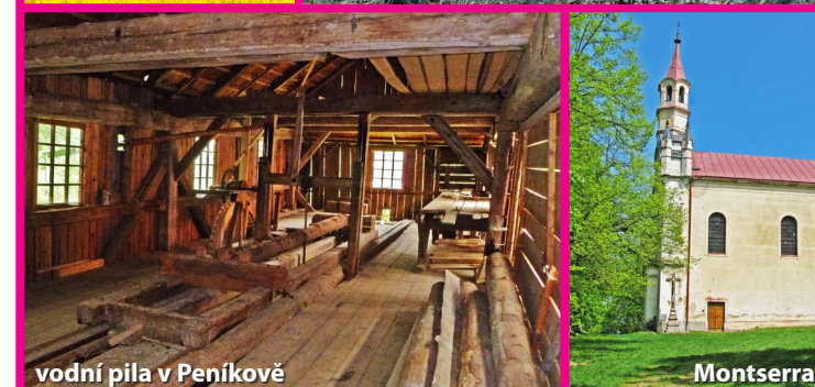
vodní pila v Penikově