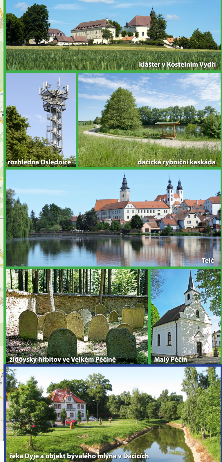
klášter v Kostelním Vydří