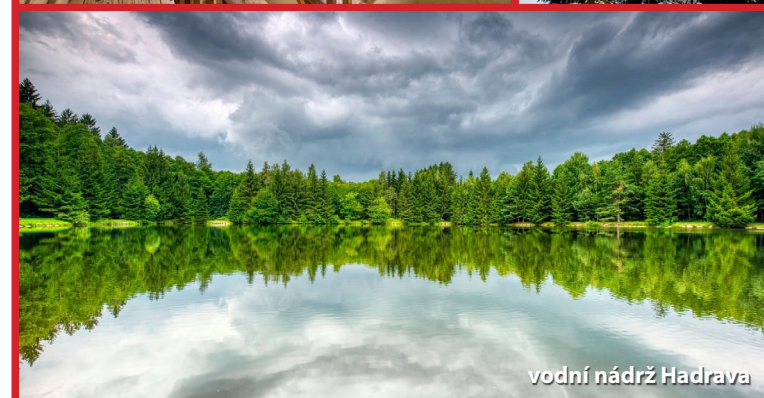
vodní nádrž Hadrava