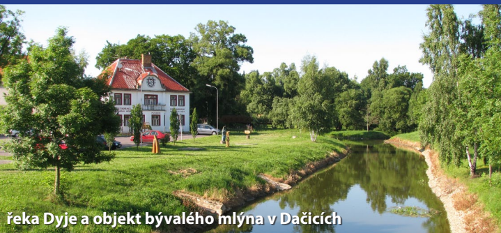
řeka Dyje a objekt bývalého mlýna v Dačicích