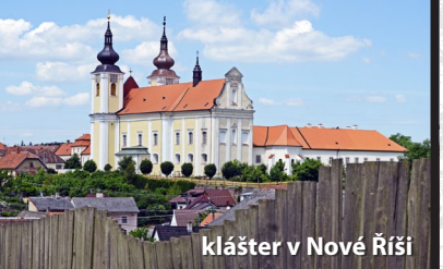
klášter v Nové Říši