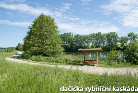
dačická rybníční kaskáda