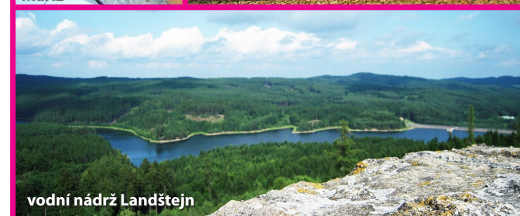
vodní nádrž Landštejn