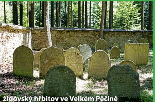
židovský hřbitov ve Velkém Pěčíně