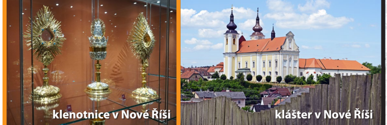
klenotnice v Nové Říši