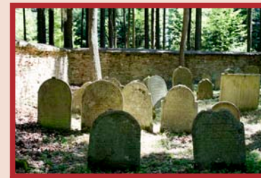
židovský hřbitov u Velkého Pěčina