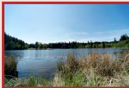
Velký pařezitý rybník

Rybník Zhejral (výměra 26,99 ha) - národní přírodní rezervace, vysoká ekologická a estetická hodnota, pestrá vegetace, výskyt 500 druhů motýlů.