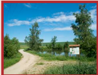
Dačická rybníční kaskáda

Dačická rybníční kaskáda – tvoří ji 19 samostatných rybníků, kolem 10 z nich vede zpevněná cesta vhodná pro pěší i cyklisty.