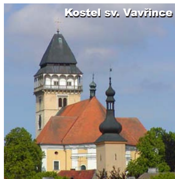
Kostel sv. Vavřince

Věž kostela sv. Vavřince – dominanta města, mohutná 52 m vysoká věž, z vyhlídkového ochozu jsou za dobrého počasí vidět mj. nedaleké Slavonice a Javořice, nejvyšší vrchol Českomoravské vrchoviny. V jednotlivých patrech je přístupná zvonice, místnost hodin a lapidárium, ve kterém jsou umístěny kopie kamenných chrličů a náhrobní kameny.