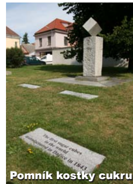
Pomník kostky cukru

Pomník kostky cukru – žulový pomník vybudovaný v roce 1983 na zelené ploše naproti vchodu do kostela sv. Vavřince, jeho bezprostřední okolí bylo v roce 2012 osazeno pamětními deskami, které ve dvanácti cizích jazycích připomínají rok 1843, kdy se na své vítězné tažení evropskými a světovými trhy vydal dačický vynález - kostkový cukr.