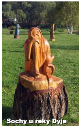
Sochy u řeky Dyje

Jak se sem dostat: Z Palackého náměstí Masarykovou ulicí k mostu. Před mostem po levé straně uvidíte galerii.